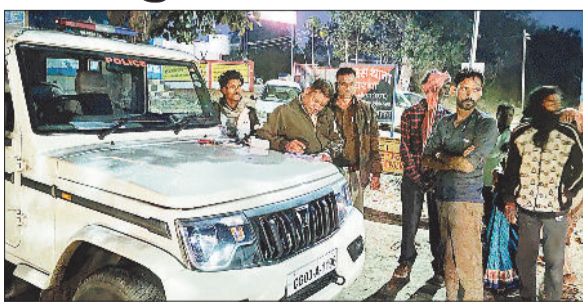
जांच कार्रवाई करती पुलिस।