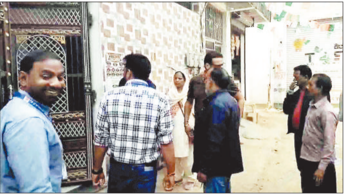
वार्डवासियों से जानकारी लेती नगर निगम की टीम।

जिसके कारण क्षेत्र में पीलिया के मरीज सामने आ रहे हैं। फिलहाल मोमिनपुरा, नवागढ़ क्षेत्र में दूषित पानी के कारण 42 पीलिया मरीजों के सामने आने की बात कही जा रही है। इधर दूषित पेयजल और पीलिया की जानकारी मिलने के बाद निगम ने भी हड़कंप मच गया है। स्वास्थ्य विभाग ने पत्र लिखकर पीएचओ व निगम को पानी की जांच करने व सावधानी बरतने की बात कही है। मामला सामने आने के बाद महापौर के निर्देश पर ननि की टीम भी शनिवार को वार्डों में सर्वे के लिए पहुंची थी। इस दौरान टीम ने कई घरों से जांच के लिए पानी का सैम्पल लिया है।