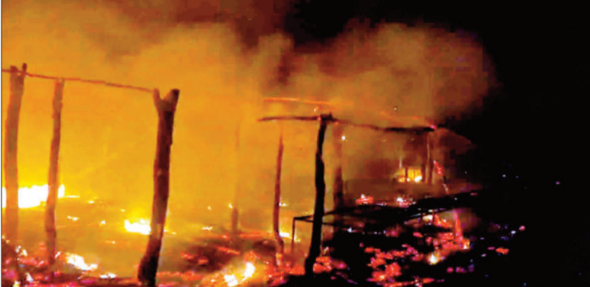
आग से जलती दुकानें।

दुकानें जलने से ग्रामीणों को भारी आर्थिक नुकसान हुआ है। मैनपाट स्थित पर्यटन स्थल टाइगर प्वाइंट में सालो भर पर्यटकों की आवाजाही रहती है तथा स्थल पर पूरे दिन पर्यटक मौजूद रहते हैं। पर्यटन स्थल के पास ही ग्राम बिजलवा के ग्रामीण होटल, स्नेक्स सहित अन्य सामग्रियों की दुकान संचालित करते हैं। ग्रामीण सुबह सामान लेकर पहुंचते हैं तथा देर शाम सामानों को लेकर अपने घर चले जाते हैं। प्लास्टिक की कुर्सियां, टेबुल एवं अन्य सामान दुकानों में ही छोड़ देते हैं। शुरुवार